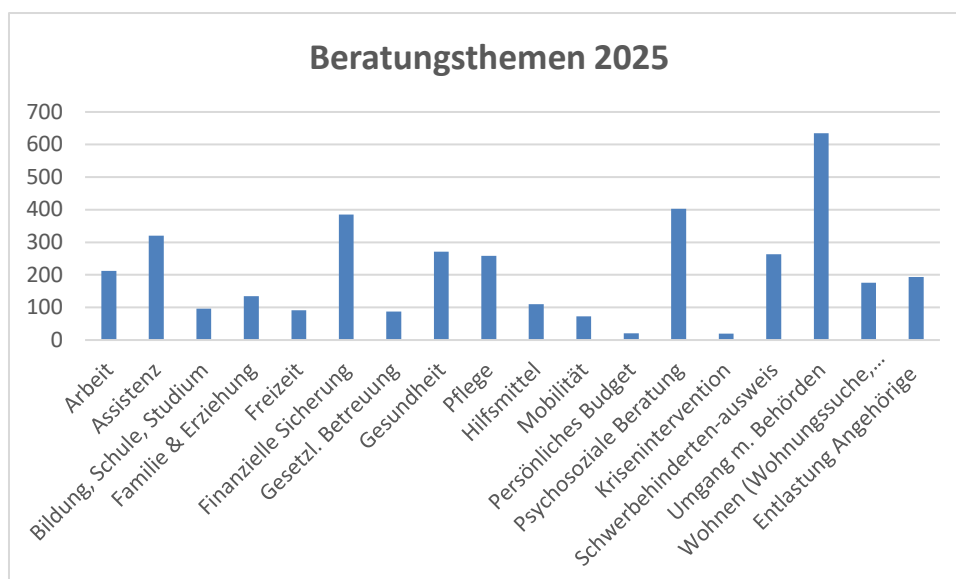
Abbildung 3: Beratungsschwerpunkte der EUTB®